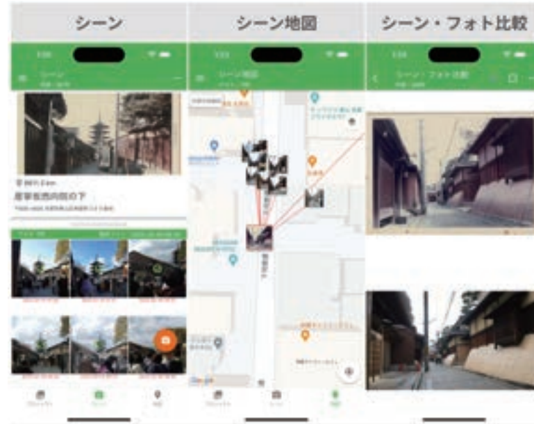
図3. メモグラの基本的な機能 文2)

メモリーグラフ(メモグラ)は同一構図撮影を支援するカメラアプリ。今昔写真、ビフォーアフター写真、定点観測写真、聖地巡礼写真、位置証明写真など、自然物や人工物の不変性と変化を可視化するフィールドワークに活用できる 文2) 。