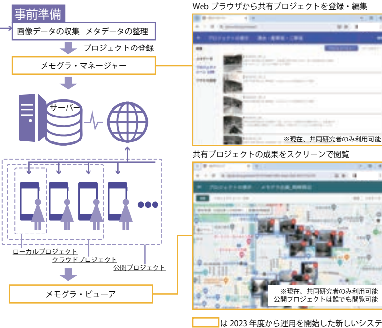
図4. メモグラのシステム概念図(公開プロジェクト)

プロジェクトモードはネットワークを介して複数のユーザ(不特定多数)でデータを共有することが可能な公開プロジェクト、複数の端末(特定の集団)でデータ共有が可能なクラウドプロジェクト、端末内でデータが完結するローカルプロジェクトの3段階が実装されており、使用する地域に合わせて公開の範囲をコントロールすることができる。2023年9月から、Web上でプロジェクトを登録・修正できるメモグラ・マネージャー、メモグラ・ビューアを試験的に公開している。