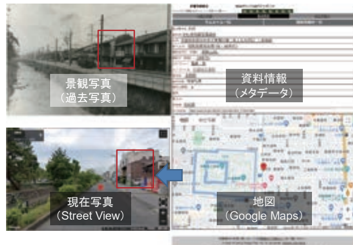
図2. 京都の鉄道・バス写真アーカイブの検索結果画面

公開日 : 2017年2月 所蔵元 : 立命館大学 アートリサーチセンター (以下、ARC) 資料数 : 約9,200点